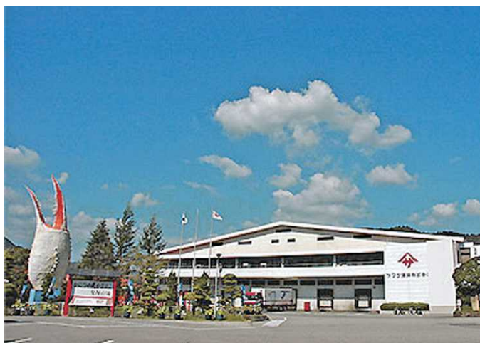
駐車場から見た工場

当社のモットーは「確かな品質、確かなうまさ」。高度な加工技術と品質管理のもと、蒲鉾、竹輪などの練り製品を製造販売しています。伝統の味を守りながら、たゆまぬ製品開発への取り組みによって、「カニ風味蒲鉾」をはじめ、オリジナリティのある商品を生み出しています。その品質が高く評価されたことをきっかけに、すり身を原料にした製品は世界のヘルシーフードとなりました。現在、アメリカ・ヨーロッパ・東南アジアなど世界に販売ネットワークをもち、グローバルに展開しています。