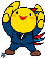
兵庫県 マスコットはばタン