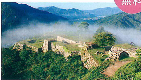
竹田城跡

だけど こんな不安はありませんか？ 仕事はあるの？ 周りの友達は都会に 出て行って、寂しくなるのでは？ ふるさとに戻るタイミングっていつ？ 同年代で活躍中の人はいいるの？